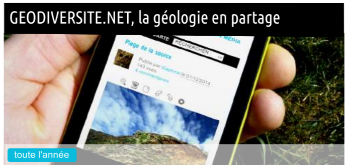
GEODIVERSITE.NET, la géologie en partage toute l'année

Géodiversité.NET est un projet coopératif, porté par la Maison des Minéraux, né de l'envie de créer ensemble et de partager de l'information sur la géologie des territoires. Découvrez en photos les richesses géologiques de la Presqu'île de Crozon, du Finistère, de la Bretagne et du monde entier. Vous aussi apportez votre pierre à l'édifice ! Pour PC, tablettes et smartphones.