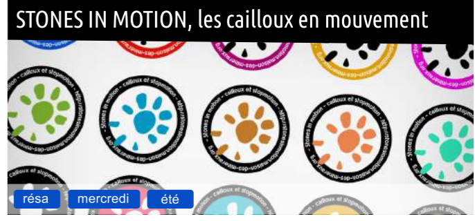
STONES IN MOTION, les cailloux en mouvement résa mercredi été

Apprenez à faire un petit film d'animation sympa en "stop motion". Empruntez des cailloux dans la nature et faites les danser, rouler, disparaître, réapparaître, voler, grandir, rétrécir, éclater, accélérer, ralentir... Vos réalisations seront partagées sur internet !