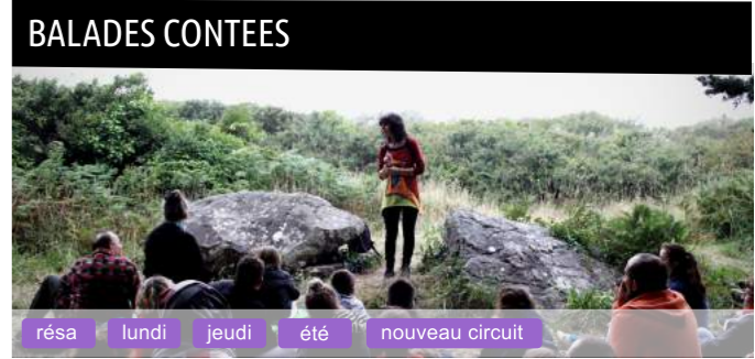
BALADES CONTEES résa lundi jeudi été nouveau circuit

Les rochers et les vagues s'affrontent sans relâche, la main de la mer sculpte l'histoire. La groac'h veille sur son trésor, korrigans et géants sont aux aguets, et les épaves du fond de l'eau remontent à la surface. Le paysage garde dans les yeux le souvenir des combats. Une randonnée pour voir et écouter les histoires de la mer, dans ce coin de presqu'île ou le panorama est déjà un rêve. Durée : 3h Tarifs : 7€ (adultes), 4€ (enfants), 20€ (famille 2A+2E) En savoir plus : www.diverrez.com