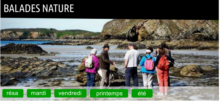
BALADES NATURE résa mardi vendredi printemps été

Aliguez votre regard en compagnie d'un guide qui vous mènera notamment sur les géosites de l'ERB pour une lecture du paysage et des éléments qui le façonnent : géologie, faune, flore et habitats humains.