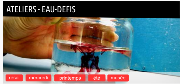
ATELIERS - EAU-DEFIS résa mercredi printemps été musée