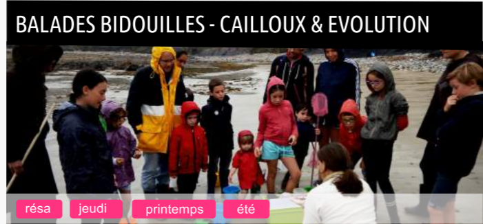
BALADES BIDOUILLES - CAILLOUX & EVOLUTION résa jeudi printemps été

Ces balades familiales où se mêlent petits et grands sont ponctuées de découvertes et d'expériences amusantes pour mieux appréhender notre environnement. Différents circuits à découvrir pour éveiller la curiosité sur les phénomènes qui nous entourent, prendre le temps d'observer, tester et comprendre. Deux formules : Cailloux d'ici et Evolution des petites bêtes de l'estran.